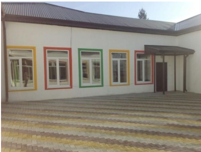
Республика Адыгея, Шовгеновский район, аул Джерокай. ООП ДО МБДОУ № 2 "Бэрэчэт"